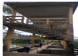
Hình 4. Đập dâng Thanh Quyết