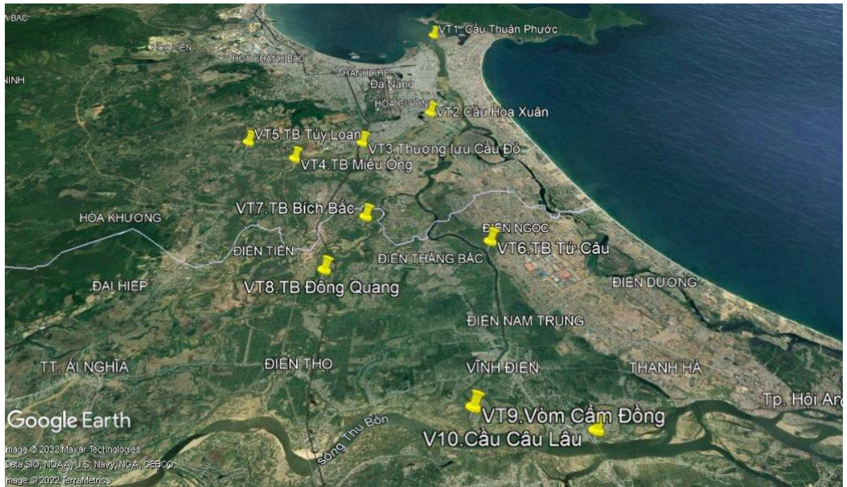
Hình 1. Vị trí các điểm quan trắc trong hệ thống thủy lợi An Trạch