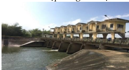
Hình 5. Đập dâng Bàu Nít