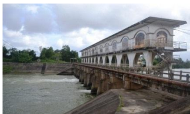
Hình 2. Đập dâng An Trạch