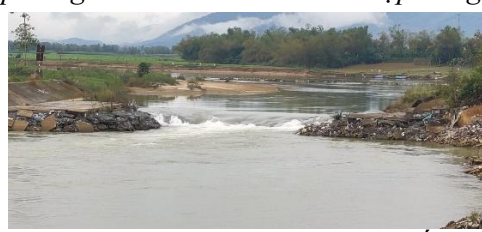
Hình 6. Đập tạm Quảng Huế