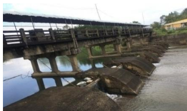
Hình 3. Đập dâng Hà Thanh