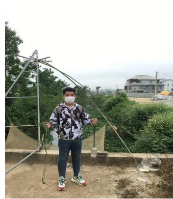
Hình 3. NMD Thủy Dương