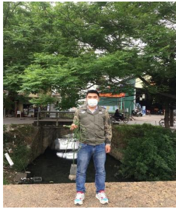
Hình 2. Cổng Phú Cam