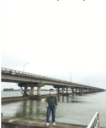
Hình 4. Đập Thảo Long