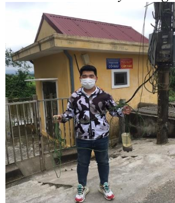
Hình 6. TB. Cổ Bưu