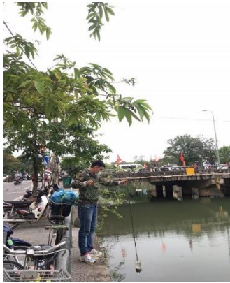
Hình 1. Chợ An Cựu