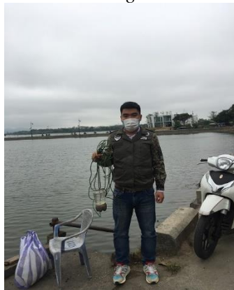
Hình 5. Đập Đá