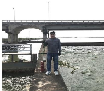
Hình 4. Đập Thảo Long