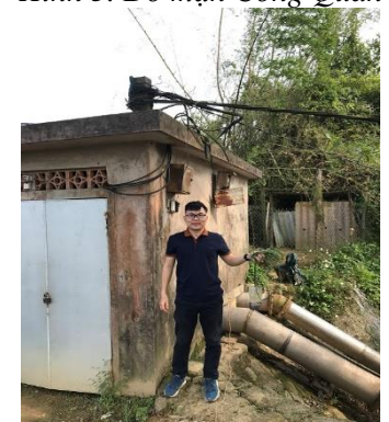
Hình 6. TB. Phú Dương