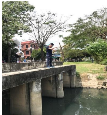
Hình 2. Cống Phú Cam