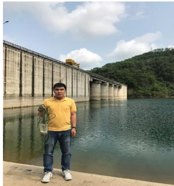
Hình 1. Hồ Tả Trạch