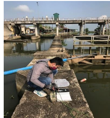
Hình 3. Đo mặn Cống Quan