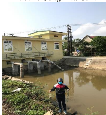
Hình 5. TB. Thủy Phù