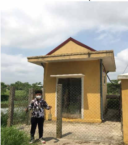
Hình 5. TB. Cổ Bưu