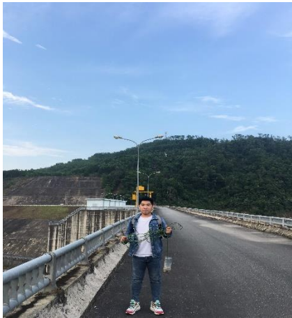
Hình 1. Hồ Tân Trạch