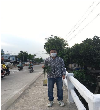
Hình 2. Cầu Vực