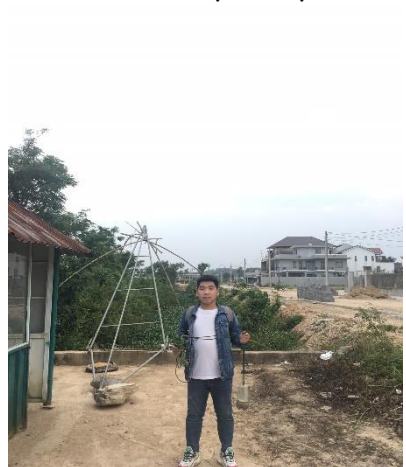
Hình 6. NMD Thủy Dương