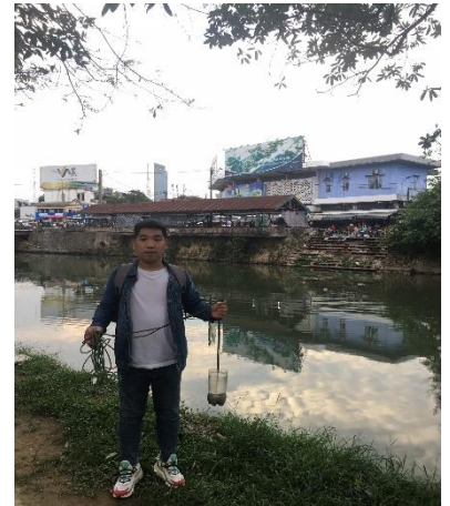
Hình 3. Chợ An Cựu