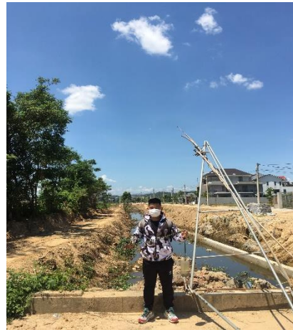
Hình 5. NMD Thủy Dương