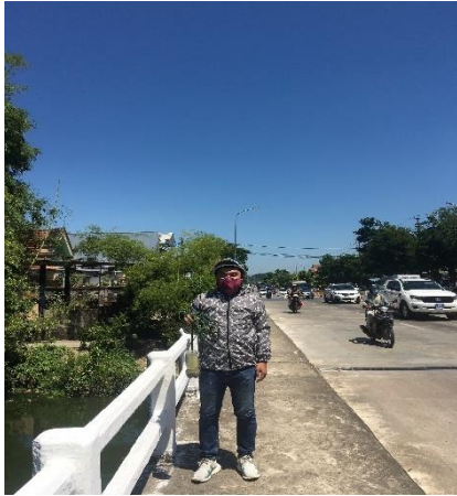
Hình 1. Cầu Vực