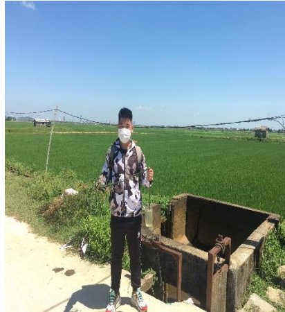
Hình 2. TB. Thủy Châu