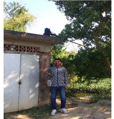
Hình 3. TB Phú Dương