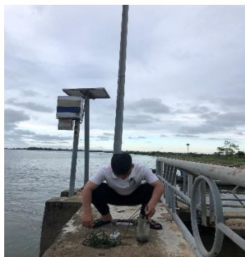
Hình 1. Đo mặn Đập Tháo Long