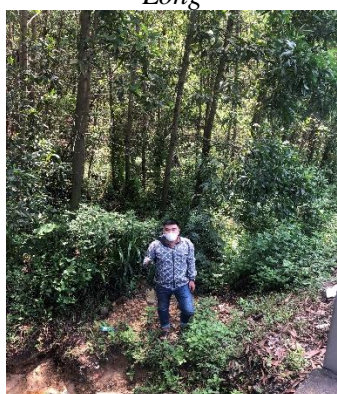
Hình 4. KCN Phú Bài