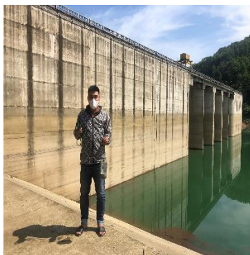
Hình 2. Hồ Tả Trạch