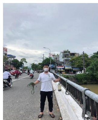
Hình 6. Chợ An Cựu