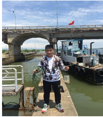
Hình 5. Đập Thảo Long