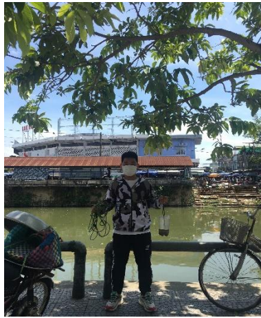
Hình 2. Chợ An Cựu