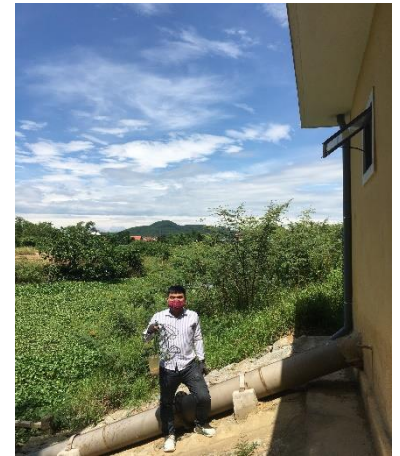
Hình 3. TB Cổ Bưu