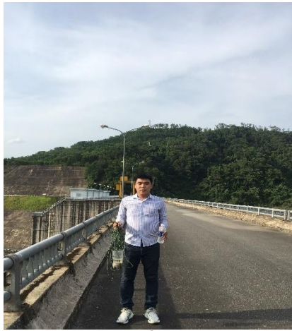
Hình 1. Hồ Tả Trạch