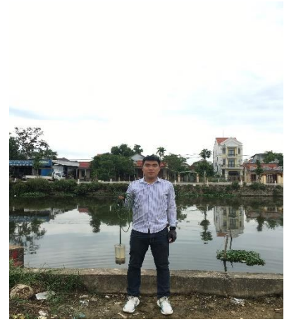
Hình 6. NMD Thủy Dương