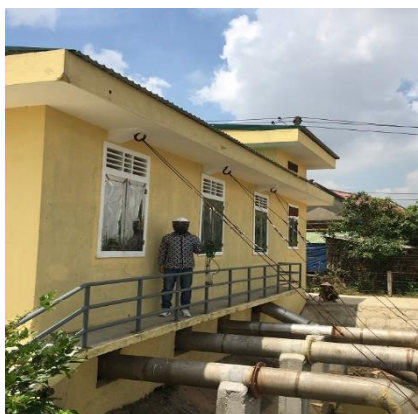
Hình 1. TB. Thủy Phù