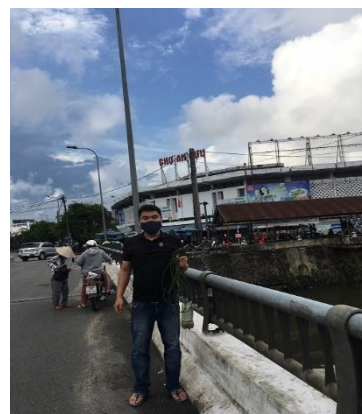
Hình 3. Chợ An Cựu