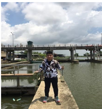
Hình 2. Cống Quan