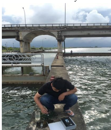
Hình 4. Đo mặn ở đập Thảo Long