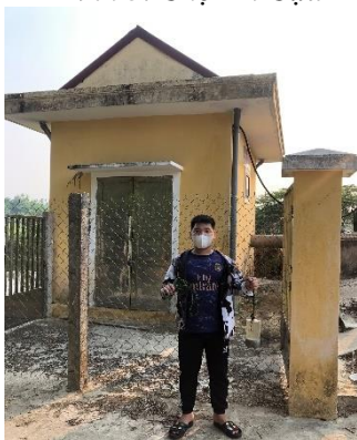
Hình 6. TB. Cổ Bưu