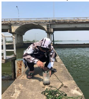
Hình 4. Đo mặn Đập Thảo Long