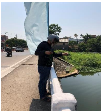
Hình 2. Cầu Vực