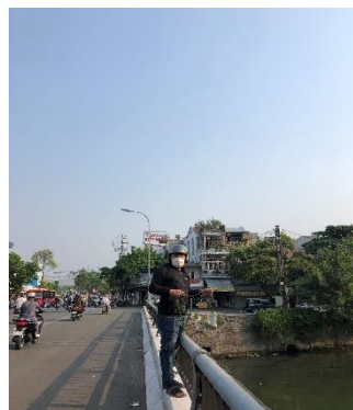
Hình 3. Chợ An Cựu