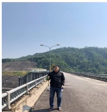
Hình 1. Hồ Tả Trạch