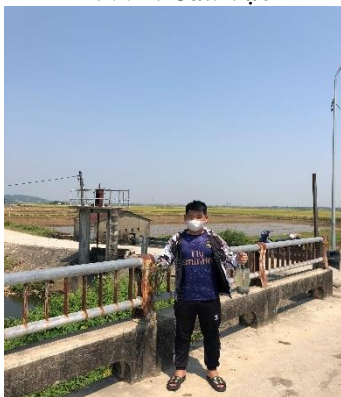
Hình 5. TB. Thủy Châu