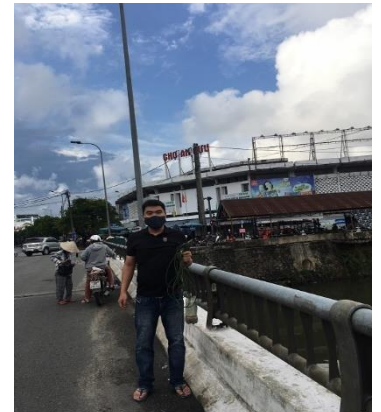
Hình 3. Chợ An Cựu