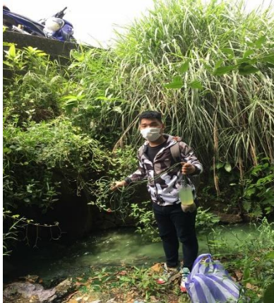
Hình 5. KCN Phú Bài