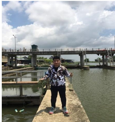
Hình 2. Cống Quan