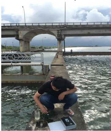
Hình 4. Đo mặn ở đập Thảo Long