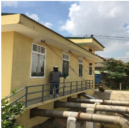
Hình 1. TB. Thủy Phù