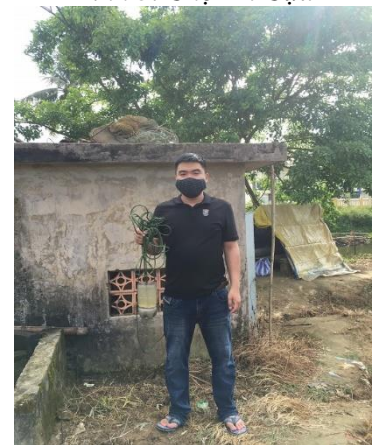
Hình 6. TB. Phú Dương