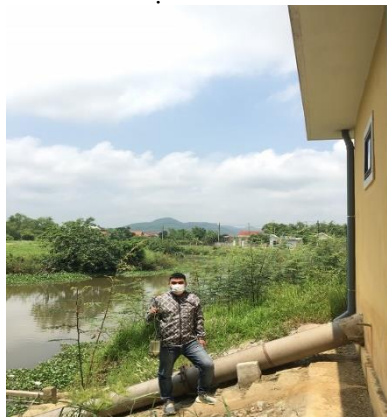
Hình 5. TB. Cổ Bưu