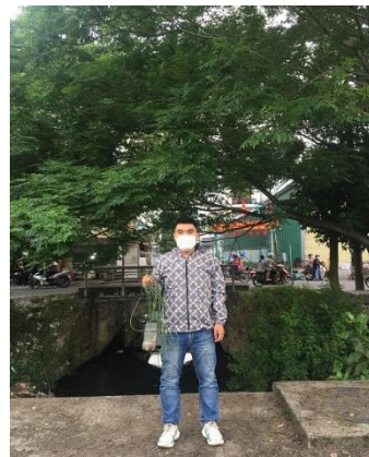
Hình 6. Cổng Phú Cam