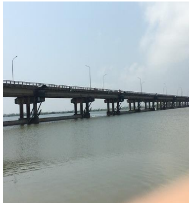
Hình 2. Đập Thảo Long mở cửa van vận hành xả nước