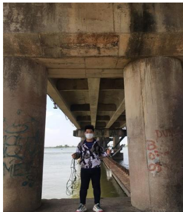
Hình 4. Đập Thảo Long