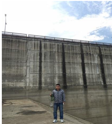
Hình 1. Hồ Tả Trạch