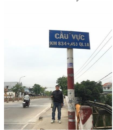
Hình 6. Cầu Vực