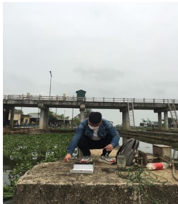
Hình 4. Đo mặn ở Cống Quan