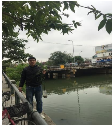
Hình 1. Chợ An Cựu