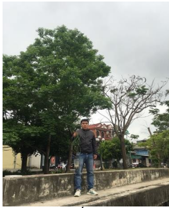
Hình 2. Cống Phú Cam