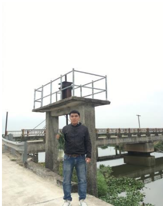
Hình 5. TB. Thủy Châu