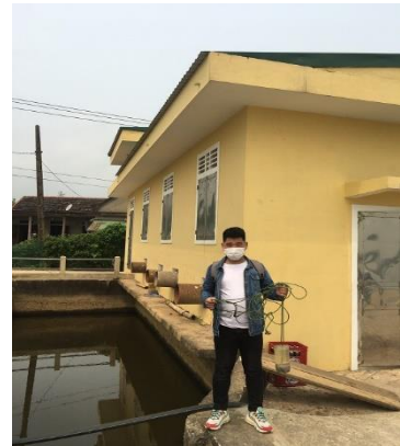
Hình 3. TB. Thủy Phù